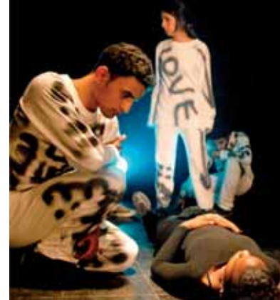
Freedom Theatre Jenin, Westbank

Heinrich-Böll-Stiftung Schleswig-Holstein, Kiel Amt für Kultur und Weiterbildung der Landeshauptstadt Kiel