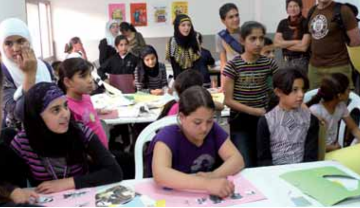
Workshop, Open Studio Shufat Camp, Ostjerusalem