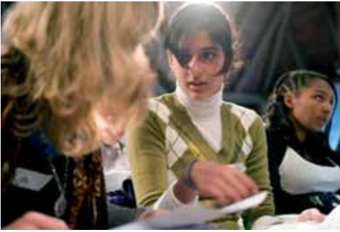
Chorprobe in Wielen