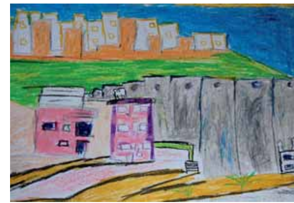
Kinderzeichnung zum Thema »Jerusalem«

besuch für einige Wochen zu den Arbeitsgruppen in Kiel, um Ergebnisse zusammenzuführen. Seine Anwesenheit führte zu einer Ausweitung der thematischen Auseinandersetzung und mündete in die gemeinsame Ausstellung »Heimat/ Belonging« mit etwa 50 Bildern und Objekten. Sie war vom 27. November 2009 bis 24. Januar 2010 in der Galerie Kieler Schulen im Rathaus zu sehen. | Eine weitere Ausstellung fand in Shufat Camp mit den dort entstandenen Bildern vom 21. bis 30. April 2010 im »Palestinian Child Centre« statt.