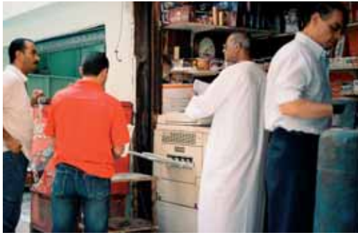
Straßenszene in Kairo, »Downtown«