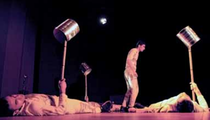
»Fragments of Palestine«, KulturForum