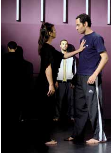
»my unknown enemy«, KulturForum