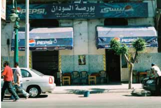
Straßenszene in Ägypten