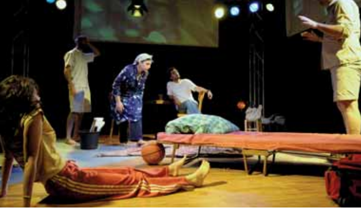
Theater-Performance »Belonging«, KulturForum