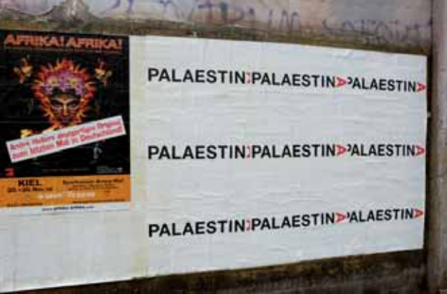
Pola Sieverding, Plakate im öffentlichen Raum, Kiel

Im Rahmen verschiedener Ausstellungen wurden Arbeiten von Teilnehmer/innen des artist-in-residence Programms »research-based art« in Kiel, Lodz und Odense präsentiert.