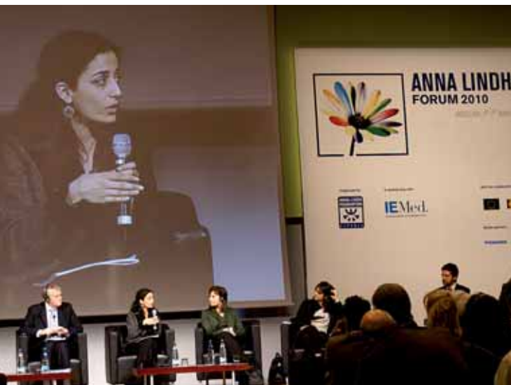
Anna-Lindh Forum 2010, Barcelona